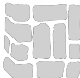
| POSA NON CORRETTA |