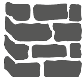
| POSA CORRETTA |